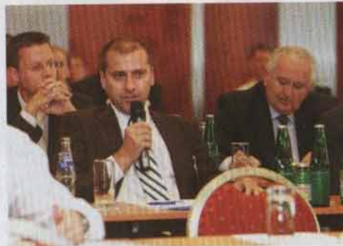
Publikumsbeteiligung: Zu fragen und zu diskutieren war nicht nur erlaubt, sondern auch erwünscht.